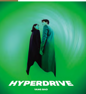
鲍杨《Hyperdrive 黑洞引擎》专辑封面