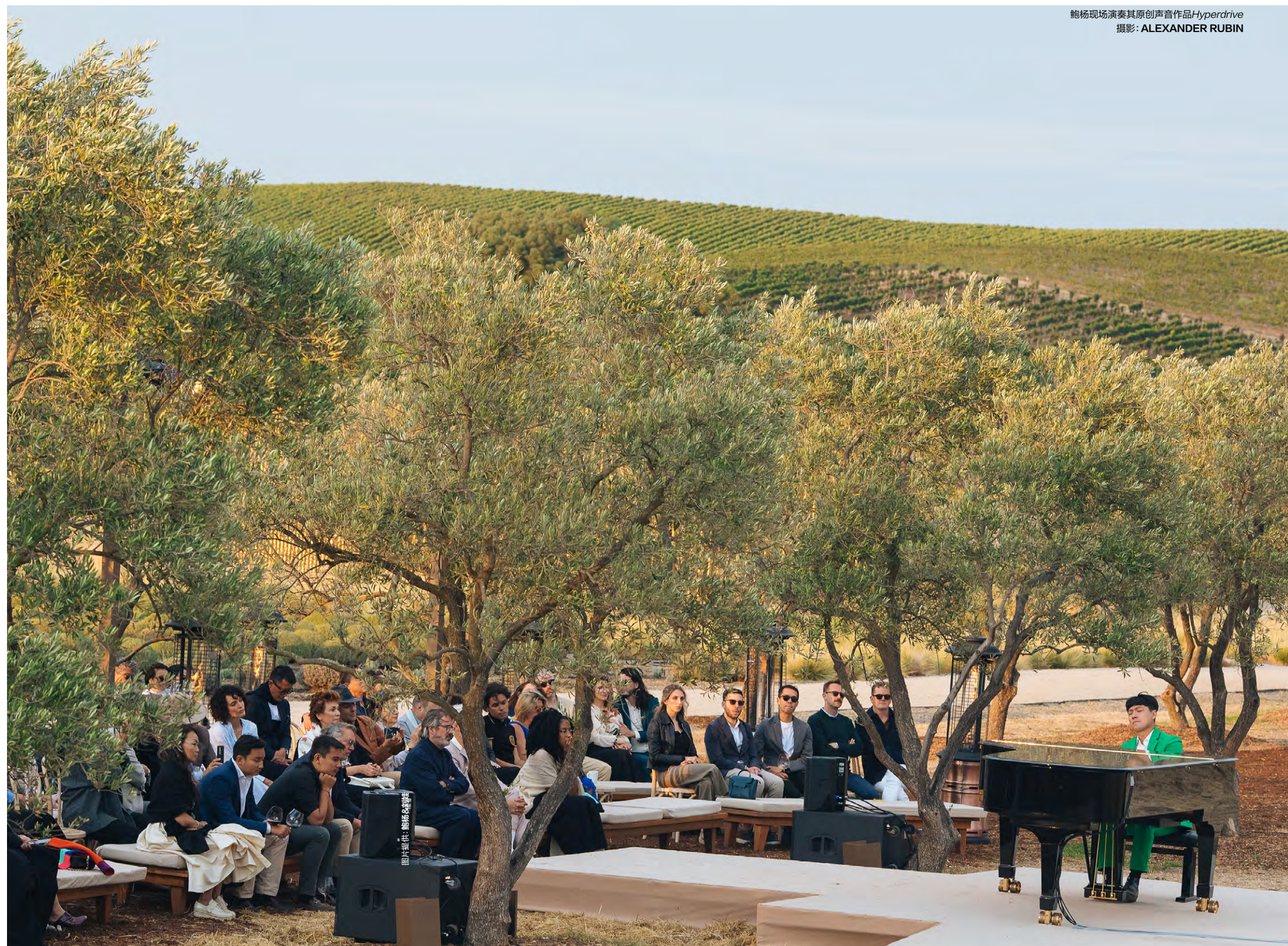
鲍杨现场演奏其原创声音作品Hyperdrive