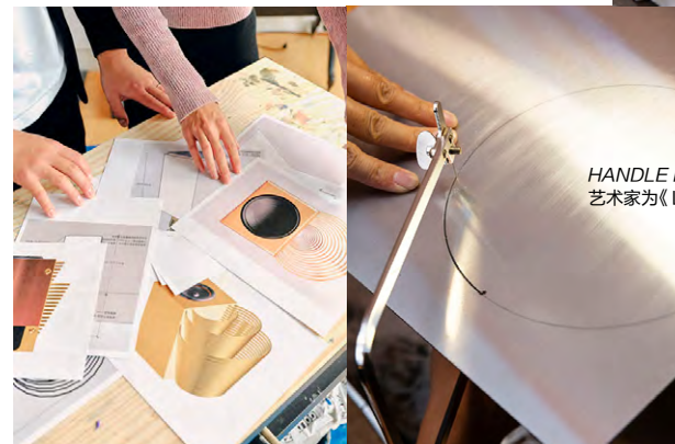
HANDLE ME (2022), 声音装置创作过程 艺术家为《LADY DIOR 我之所见》展览项目创作