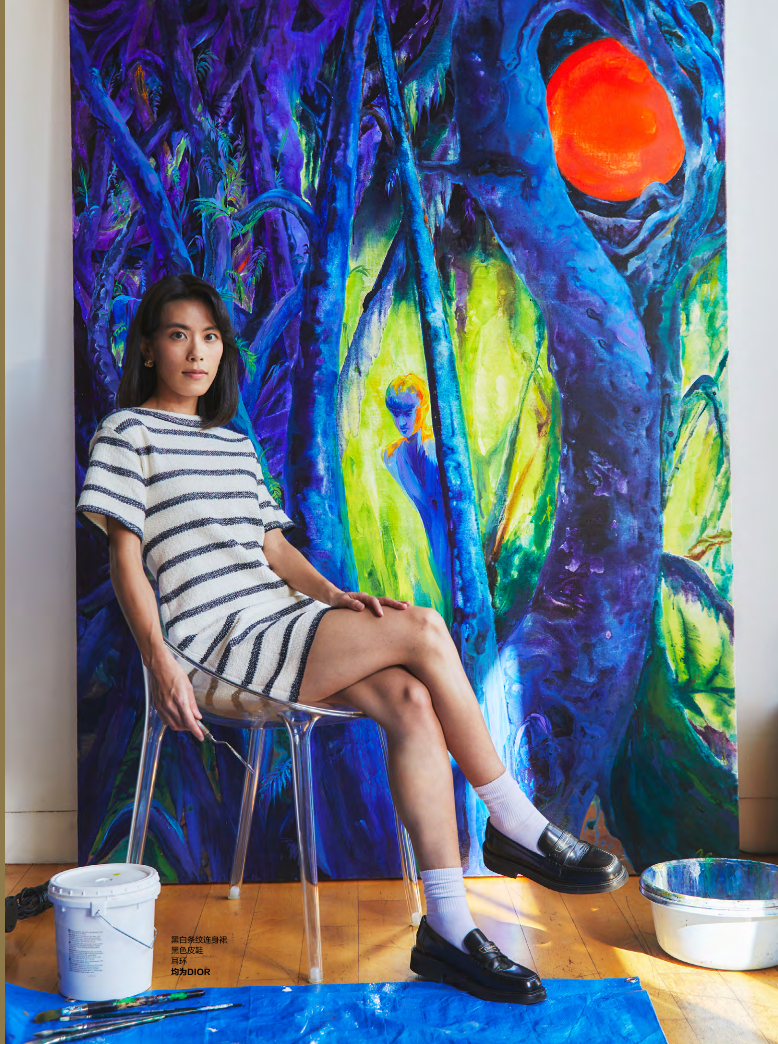
黑白条纹连身裙 黑色皮鞋 耳环 均为DIOR